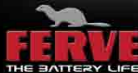
F-2320 CARGADOR AUTOMATICO DUAL